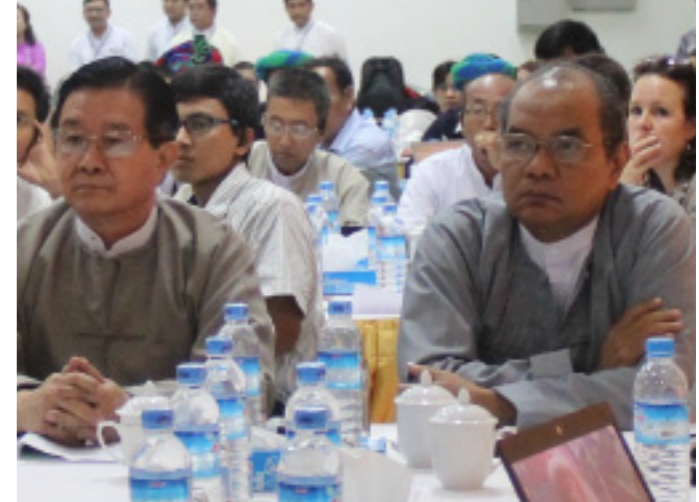
စာတိုက် - ဝါရာသန်ကန်ထရို

ဤပူးပေါင်းဦးဆောင်အဖွဲ့အနေနှင့် လုပ်ငန်းစဉ်များအပေါ် လမ်းညွှန်မှုများ ချမှတ်ပေးပါသည်- မည်သို့သောကဏ္ဍများတွင် ပြည်ပမှ ကျွမ်းကျင်ပညာရှင်များနှင့်အတွေ့အကြုံများကိုလေ့လာလိုသည်၊ တောင်းဆိုလိုသည်မည်သည့်ကိစ္စများ၊ ငြိမ်းချမ်းရေးလုပ်ငန်းစဉ်ဆိုင်ရာဆွေးနွေးပွဲဆင်ပိုမိုယမ များ ကျင်းပရန် အချိန်သတ်မှတ်ပေးခြင်း၊ ရှေ့လုပ်ငန်းစဉ်များ၊ ဆွေးနွေးပွဲများကို အကောင်အထူး အထောက်အကူပေးနိုင်မည့်