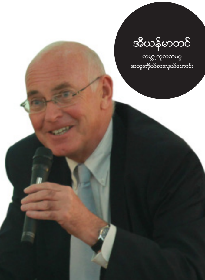
အီယန်မာတင် ကမ္ဘာ့ကုလသမဂ္ဂ အထူးကိုယ်စားလှယ်ဟောင်း