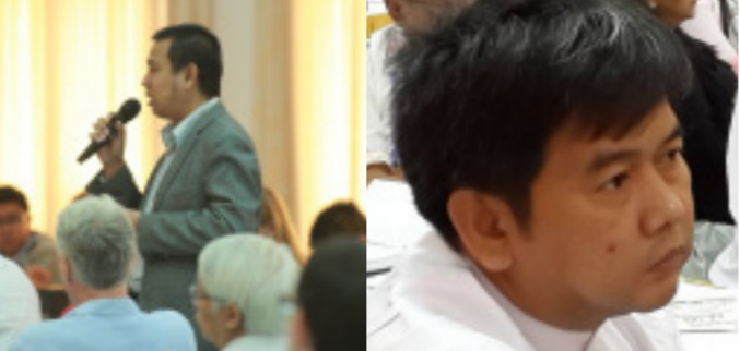
စာတိုက် - ဝါရာသန်ကန်ထရို

ကမ္ဘာ့နိုင်ငံအသီးသီးအနေနှင့် မည်သို့မည်ပုံ ဆောင်ရွက်ကြသည်ကို မိမိတို့၏ လက်တွေ့နယ်ပယ်မှ အတွေ့အကြုံများအပေါ် အခြေခံ၍ မျှဝေသွားရန် စီစဉ်ထားပါသည်။ အစိုးရ၏ ငြိမ်းချမ်းရေးဆွေးနွေးရေးအဖွဲ့ဦးဆောင်သူ ပြည်ထောင်စုဝန်ကြီး ဦးအောင်မင်း ကလည်း အခြား နိုင်ငံတကာ ငြိမ်းချမ်းရေး လုပ်ငန်းစဉ်များတွင် လက်တွေ့ဆောင်ရွက်ခဲ့ကြသည့် ပုဂ္ဂိုလ်များနှင့် ကျွမ်းကျင်ပညာရှင်များကို ဖိတ်ခေါ်လေ့လာခြင်းသည် မြန်မာ့ငြိမ်းချမ်းရေးဖြစ်စဉ် အတွက် များစွာ အထောက်အကူ ပြုလိမ့်မည်ဟု ယုံကြည်ပါကြောင်း ပြောကြားပါသည်။