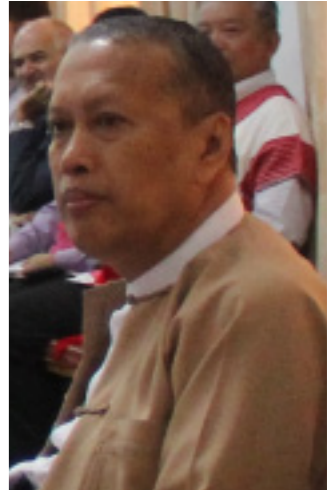
စာတိုက် - နေအောင်မိုင် (MPC)