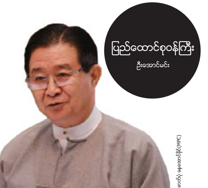
ပြည်ထောင်စုဝန်ကြီး ဦးအောင်မင်း

"ကျွန်တော်တို့ရဲ့ ငြိမ်းချမ်းရေးဖြစ်စဉ်ဟာ အလွန် အရေးကြီးတဲ့ လမ်းဆုံလမ်းခွက ရောက်ရှိနေပါပြီ။ အခြား နိုင်ငံတကာ ငြိမ်းချမ်းရေး လုပ်ငန်းစဉ်တွေမှာ လက်တွေ့ဆောင်ရွက်ခဲ့ကြတဲ့ ပုဂ္ဂိုလ်တွေ၊ ပညာရှင်တွေကို ဖိတ်ခေါ် လေ့လာတာဟာ မြန်မာ့ငြိမ်းချမ်းရေး ဖြစ်စဉ်အတွက် များစွာ အကျိုးပြုနိုင်မှာ ဖြစ်ပါတယ်။ အခြားနိုင်ငံတွေက အတွေ့အကြုံတွေ၊ သင်ခန်းစာတွေကို လေ့လာနိုင်ရင် ငြိမ်းချမ်းရေးရဖို့ အခွင့်အလမ်း ပိုမိုများလာနိုင်မှာပါပဲ။ ငြိမ်းချမ်းရေးရှိမှသာ ဒီမိုကရေစီကို တည်ဆောက်နိုင်မှာ။ နောင်လာနောက်သားများအတွက် စည်ပင်ပြောတဲ့ အနာဂတ်ကို ဖန်တီးနိုင်မှာဖြစ်လို့ ငြိမ်းချမ်းရေးဟာ အုတ်မြစ်သဖွယ် ဖြစ်ပါတယ်။ ဒါကြောင့် ကျွန်တော်တို့ ဘယ်နည်းနဲ့မှ ဒီ ငြိမ်းချမ်းရေးဖြစ်စဉ်ကြီး ရပ်တံ့မသွားစေဘဲ အောင်မြင်အောင် ဆောင်ရွက်ကြရမှာ ဖြစ်ပါတယ်။"