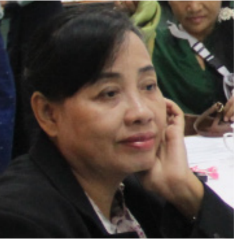
စာတိုက် - ဝါရာသန်ကန်ထရို

Beyond Ceasefires Initiative ၏ ဒါရိုက်တာ Sofia Busch ဆိုဖီယာဘတ်စချ်က ယခု အစီအစဉ်မှာ တဖြည်းဖြည်း တိုးမြှင့်ဆောင်ရွက်သွားရန် ရည်ရွယ်ထားသည့် အစီအစဉ်ဖြစ်ပါကြောင်း၊ ဤအစီအစဉ်တွင် နှစ်ဖက်အဖွဲ့အစည်းများအနေနှင့် ငြိမ်းချမ်းရေးလုပ်ငန်းစဉ်နှင့်စပ်လျဉ်း၍ နိုင်ငံတကာအတွေ့အကြုံများကို မည်သည့်ကဏ္ဍများတွင် အထူးလေ့လာလိုသည်ဆိုသည့် အခါတွင်မူ နှစ်ဖက်ဆွေးနွေး ဖက်များ က သဘောတူညီပြီဆိုသည့်အခါမှ ယင်းသို့ ဆွေးနွေးမှုများကို စီစဉ်ပေး ရန် ရည်ရွယ်ထား ပါကြောင်း ပြောကြားပါသည်။ "ဒီအစီအစဉ်က လိုအပ်မှု demand အပေါ် အခြေခံပြီး ဆောင်ရွက်ဖို့ဖြစ်ပါတယ်။ ငြိမ်းချမ်းရေး ဖြစ်စဉ်မှာ ဘက်အသီးသီးက ပါဝင်ကြတဲ့ ခေါင်းဆောင်များရဲ့ တောင်းဆိုမှု