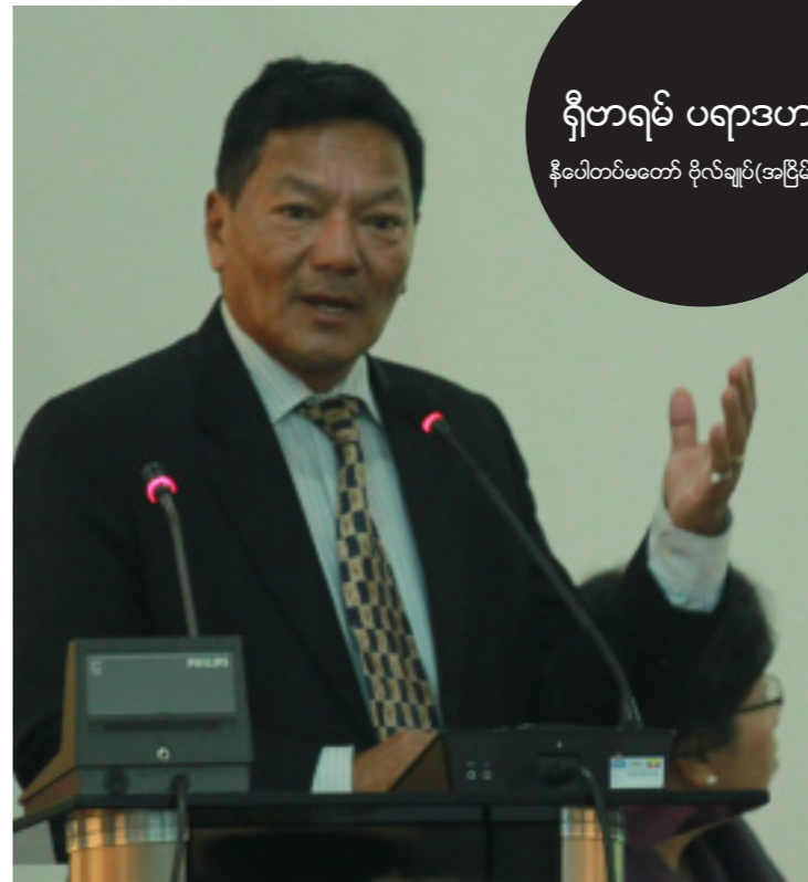
ရှိဗာရမ် ပရာဒဟန် နီပေါတပ်မတော် ဗိုလ်ချုပ်(အငြိမ်းစား)