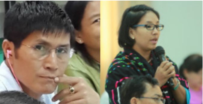
စာတိုက် - ဝါရာသန်ကန်ထရို