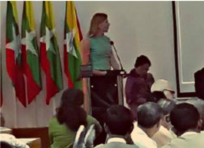
ဆင်ပိုစီယမ်ဆွေးနွေးပွဲ (MPC)

ဒီဇိုင်း ဆိုတာကာဟရီ ဆက်သွယ်ရန် beyondceasefires@gmail.com